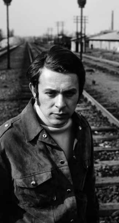
Prvi nastup s kvartetom 4M imao je u studenome 1956. godine